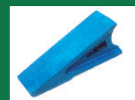
PUNTA SOCA REF: PSO-AZUL-5