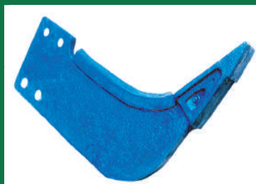
BRAZO SUBSOLADOR RECTO REF: BRS-AZUL-3