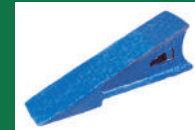
PUNTA SUBSOLADOR REF:PSB-AZUL-3