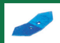
PUNTA TAPADORA REF: PT-AZUL-1