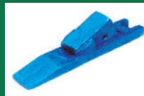
PUNTA ABONADORA REF: PAB-AZUL-1