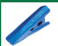
PUNTA SUBSOLADOR REF: PSB-AZUL-1