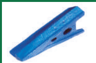
PUNTA SUBSOLADOR REF: PSB-AZUL1