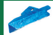
PUNTA ABONADORA REF: PAB-AZUL-2