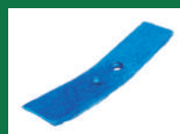
PUNTA BONFOR REF: PB-AZUL-1