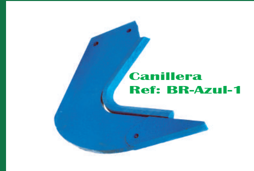
CENTANDEM LARGO REF: BR-AZUL-2