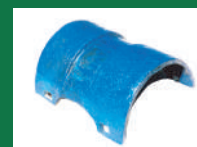
PROTECTOR CHUMACERA TATU REF: TCT-AZUL-1