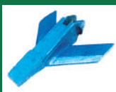
Punta deflectora minitandem Ref: PDE-Azul-4