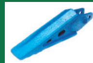
PUNTA SUBSOLADOR CON OREJA REF: PSB-AZUL-2