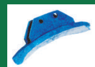
PUNTA ESCARDILLO REF: PES-AZUL-1