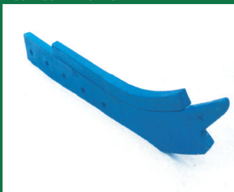
BRAZO ABONADOR REF: BR-AZUL-4