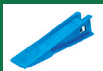
PUNTA SOCA REF: PSO-AZUL-3