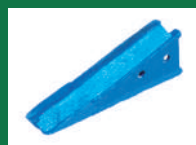
PUNTA SOCA DOS HUECOS REF: PSO-AZUL-4