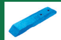
PUNTA ARADO CINCEL REF: PAC-AZUL-1