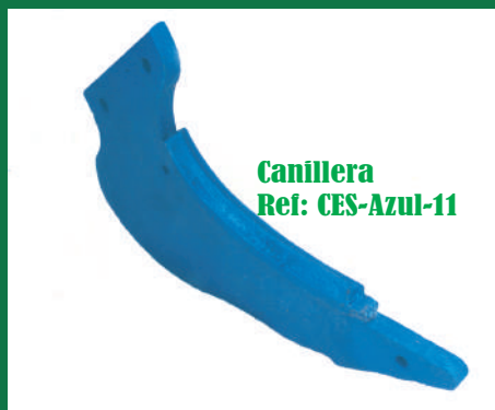
Canillera Ref: CES-Azul-11