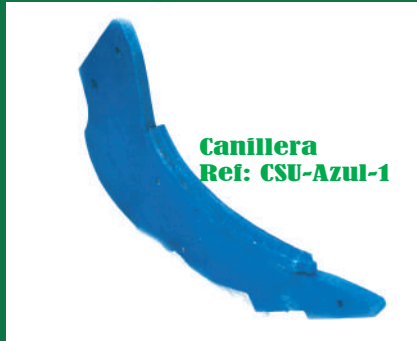
Canillera Ref: CSU-Azul-1