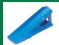
PUNTA SOCA REF: PSO-AZUL-1