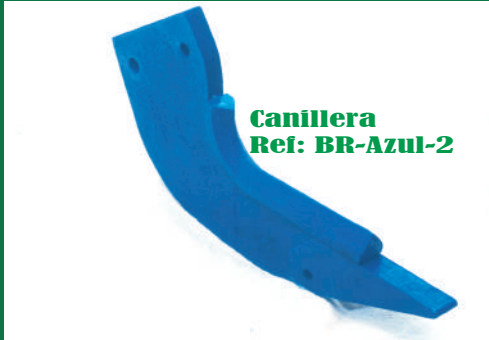
CENTANDEM CORTO REF: BR- AZUL 1