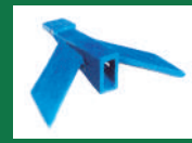
Punta deflectora Ref: PDE-Azul-6