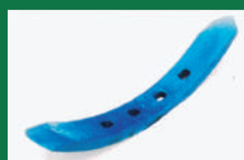
PUNTA ARADO TATU REF: PAT-AZUL-1