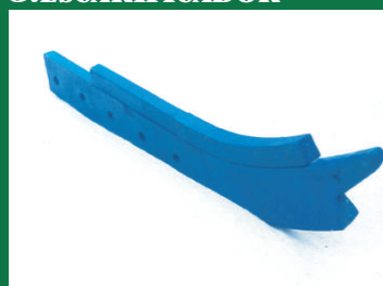
BRAZO ABONADOR REF: BR-AZUL-4