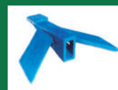
Punta deflectora Ref: PDE-Azul-6