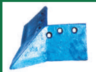
PUNTA SURCADORA REF: PS-AZUL-1